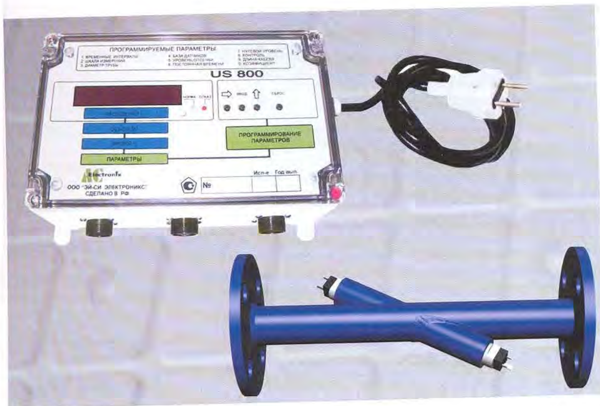
Рисунок 1 - Общий вид расходомера-счетчика жидкости ультразвукового US800 и УПР

Конструктивно ЭБ представляет собой герметичный пластиковый приборный корпус для настенного монтажа.